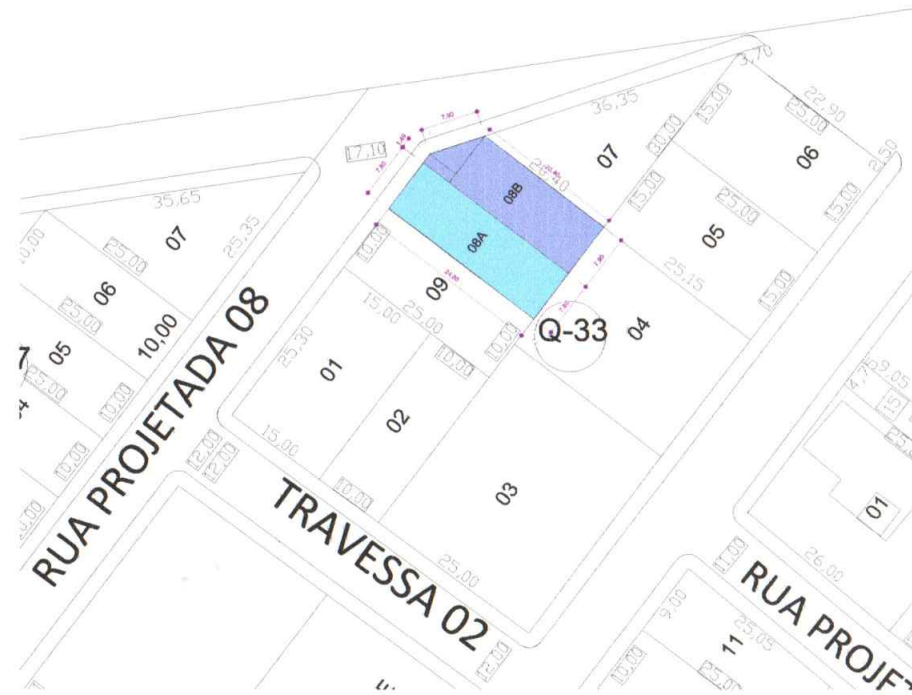
2 PLANTA DE DESMEMBRAMENTO ESCALA - 1 : 500